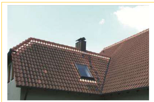
Verarbeitung an Graten